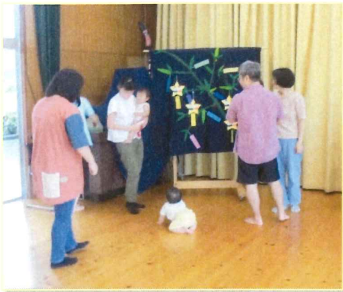
笹の葉タペストリー にお星さまの短冊を 飾りました。