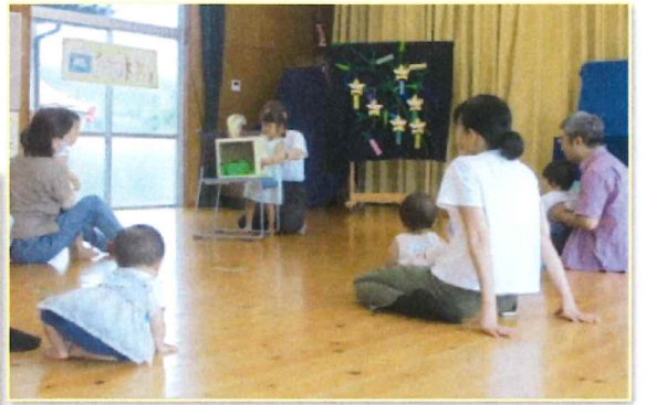
「箱の中身はなんだろう？」ゲーム。 2歳の女の子が挑戦して、みごと正解！