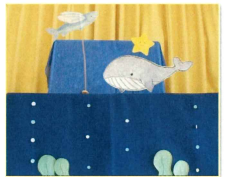
オリジナルのペープサート 「海におこちた星の子ちゃん」。 お星さまを空に帰そうと、 海の仲間が頑張ります。