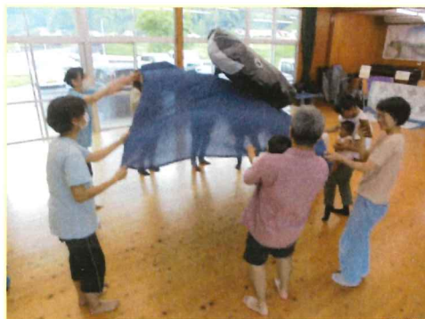
大きなくじらバルーン登場！

四季折々の節目には、小さな祝 い事や大きなお祭りなど、多くの 行事があります。自然の移ろいに 目を向け、赤ちゃんの頃から四季 の行事に参加させてあげたいです ね。体験を通して心のひだが大き くなり、心が豊かになることで しょう。